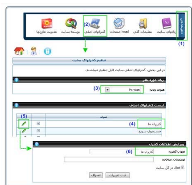
(تصویر شماره دو)

و اما بخش خوب تغییرات که بسیار مورد در خواست کاربران بود یعنی امکان تغییر عنوان کنترل ها، به تصویر شماره دو در پایان پاراگراف دقت کنید. در بخش تنظیمات کلی (1) در قسمت کنترل های اصلی (2)، پس از انتخاب زبان (3) برای هر کنترل (4) امکان ویرایش (5) گذاشته شده که شما می توانید عنوان کنترل را تغییر دهید (6).