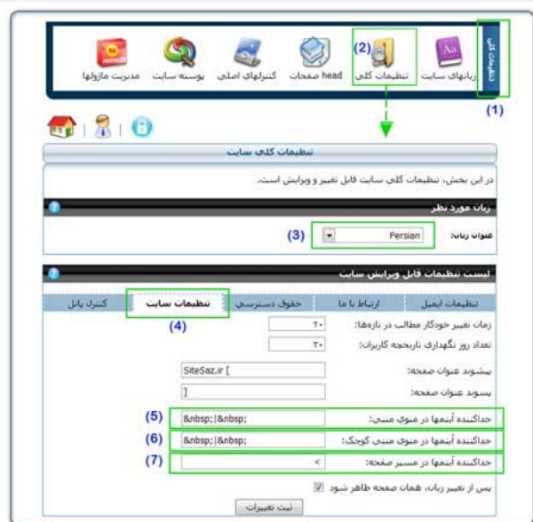
(تصویر شماره سه)

و در آخر، یک خبر خوب برای طراحان اسکین. در نگارش سرویس پک سایت ساز این قابلیت اضافه شده است که شما می توانید نماد هایی (Symbols) که بین آیتم های منوی مننی، منوی مننی کوچک و مسیر صفحه وجود دارد را نیز تغییر دهید. تصور شماره سه را ببینید. این امکان در بخش تنظیمات کلی کنترل پنل (1) در قسمت تنظیمات کلی (2) قرار دارد. پس از انتخاب زبان (3) در قسمت تنظیمات سایت (4) شما می توانید جدا کننده آیتم ها را در منوی مننی (5)، منوی مننی کوچک (6) و مسیر صفحه (7) تنظیم کنید. در هنگام نمایش کنترل در سایت، عنوان انتخاب شده شما به نمایش درخواهد آمد.