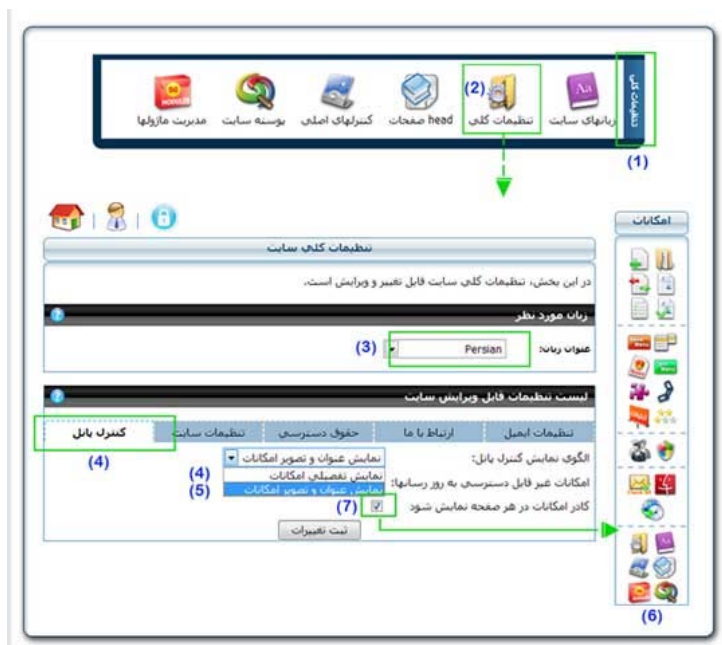
(تصویر شماره یک)

به غیر از این موارد، بر اساس دسترسی هایی که مدیر سایت به اعضا می دهد، نمایش آیکون های کنترل پنل متفاوت خواهد بود. این امکان در بخش دسترسی های کنترل پنل به تفصیل گفته خواهد شد. همانطور که در تک تک صفحه های کنترل پنل این نگارش امکان یا امکاناتی اضافه شده و امکانات قبلی بهینه شده اند، از لحاظ گرافیکی نیز تغییراتی به وجود آمده است. واضح ترین این تغییرات حالت کاملاً فشرده صفحه اصلی کنترل پنل است (نمایش فقط آیکونهای امکانات) (7) که در همه صفحه ها وجود دارد و امکان دسترسی به تمام سر فصل های کنترل پنل در هر صفحه ای وجود داشته باشد. البته فعال بودن یا نبودن این امکان نیز قابل تنظیم است (8).